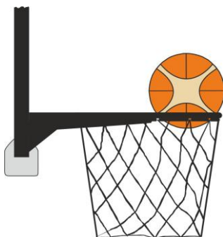
Διάγραμμα 3. Μπάλα μέσα στο καλάθι

31-17 Κατάσταση Είναι παράβαση παρέμβασης (basket interference) εάν ένας αμυνόμενος παίκτης αγγίζει τη μπάλα ενώ η μπάλα είναι μέσα στο καλάθι.