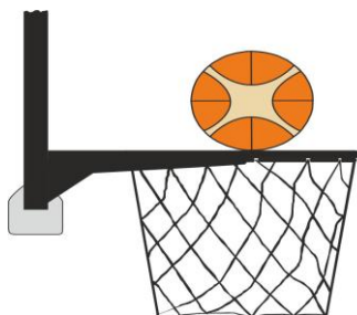
Διάγραμμα 2. Η μπάλα σε επαφή με τη στεφάνη

31-12 Παράδειγμα: Μετά από προσπάθεια για καλάθι από τον Α1, η μπάλα έχει αναπηδήσει από τη στεφάνη και έπειτα πάλι «προσγειώνεται» στη στεφάνη. Ο Β1 αγγίζει το καλάθι ή το ταμπλό ενώ η μπάλα είναι ακόμα στη στεφάνη.